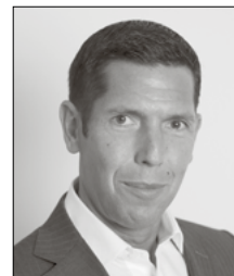
Thomas Herbert Magazine zum Globus