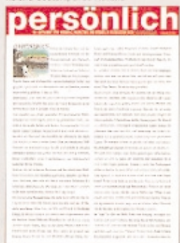
September 1997 Andy Steiner