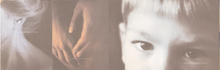
Januar 1997: Titelstory von Peter Hebeisen

Kreative Ideen und Experimente sind für uns nicht nur wichtig, sondern eine 'conditio sine qua non' bzw. eine Frage des Überlebens unserer gesamten Branche."