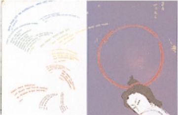
April 1997: Titelstory von K. D. Geissbühler