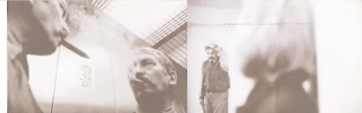
März 1997: Titelstory von Farner Publicis