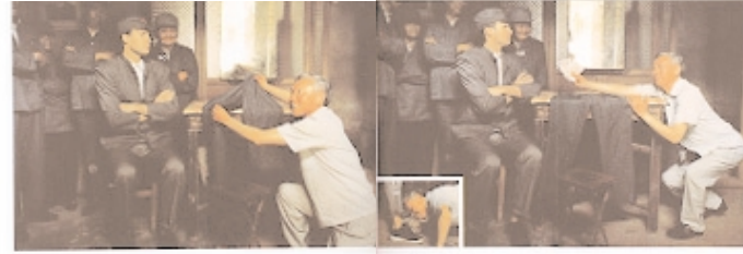
August 1997: von Joakim Jonason, Paradise DDR