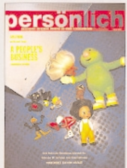
Februar 1997 Aeb, Strebel