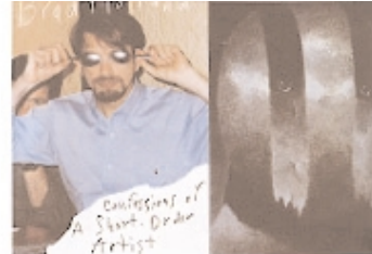
Mai 1997: Titelstory von Roland Scottoni, Brad Holland