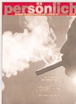
März 1997 Farnet Publicis