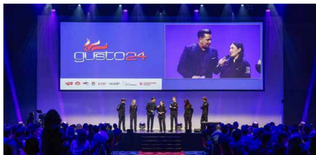
Transgourmet Schweiz AG.

«gusto», die Schweizer Meisterschaft für Kochlernende im 2./3. Lehrjahr, wird seit 2005 jährlich durchgeführt. In enger Zusammenarbeit mit dem Schweizer Kochverband wird jeweils eine neue Wettbewerbsaufgabe mit vorgegebenen Komponenten definiert. Am 7. März 2024 kochten sechs Finalteilnehmende unter Beobachtung einer internationalen Jury in Baden um den Sieg. Tags darauf fand die Show mit Siegerehrung im KKL Luzern statt, im Beisein von über 400 Gästen und moderiert von Sven Epiney. Seit 2005 haben über 2000 Kochlernende teilgenommen.