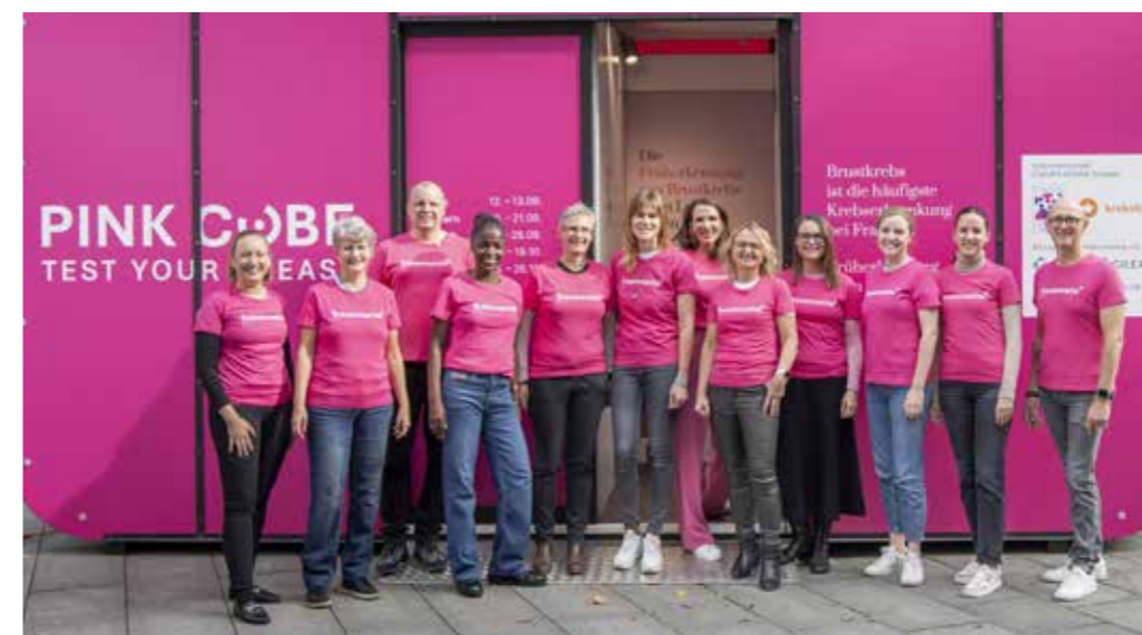
Credo GmbH PR & Communications.

Der PluSport-Tag ist der grösste und bedeutendste Behindertensporttag der Schweiz und setzt Massstäbe für gelebte Inklusion und ein einzigartiges Miteinander in der Schweiz. Jedes Jahr kommen rund 1700 Athletinnen und Athleten, deren Familien und