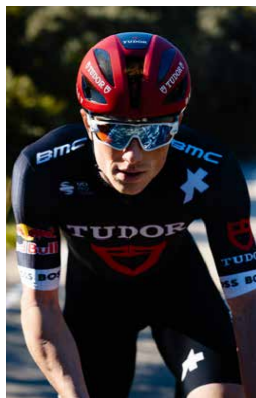
Tudor Pro Cycling Team.

Die crossmediale Kampagne «Ein Team sind immer alle» positionierte UBS im Sommer 2024 als neuen Keyplayer im Schweizer Fussball. Der Titel soll internen und externen Stakeholdern Orientierung bieten und