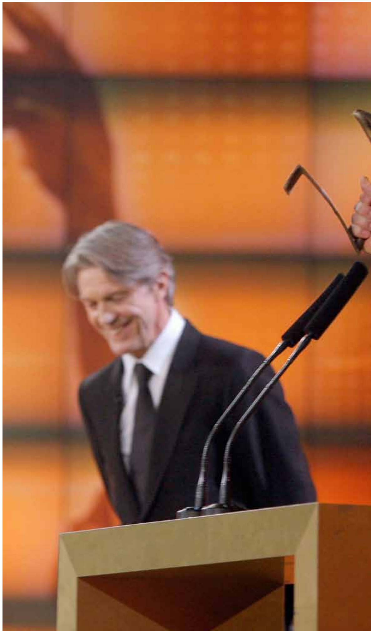
Sportliches Dream-Team: Alt-Bundesrat Adolf Ogi mit Sportlegende Bernhard Russi bei der Verleihung der Credit Suisse Sports Awards 2007, am Samstag, 15. Dezember 2007, in Bern.

Natürlich. Aber auch hier prägte mich mein Vater: Er war nie schlecht gelaunt oder zu müde, um etwas anzupacken. Er sagte mir immer: «Man kann Berge nicht versetzen, das Leben neben oder unter ihnen aber verbessern.» So sorgte er beispielsweise dafür, dass in Kandersteg der Wetterbach umgeleitet wurde, damit die kleinen Dörfer bei Hochwasser nicht mehr überschwemmt wurden. Diese positive Kraft, Veränderungen anzupacken, wurde mir also in die Wiege gelegt.