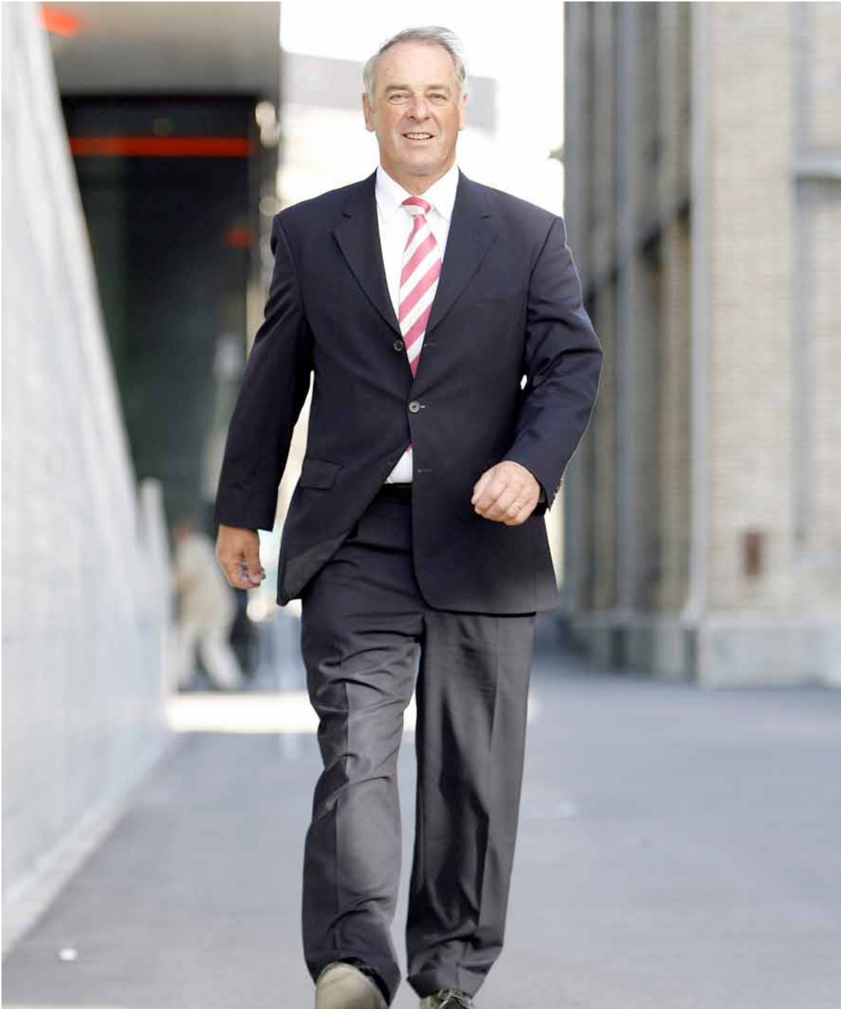
Alt-Bundesrat Adolf Ogi: «Wir lassen nicht nur das Wasser von Kandersteg ins Tal hinunter, sondern können auch etwas werden.»