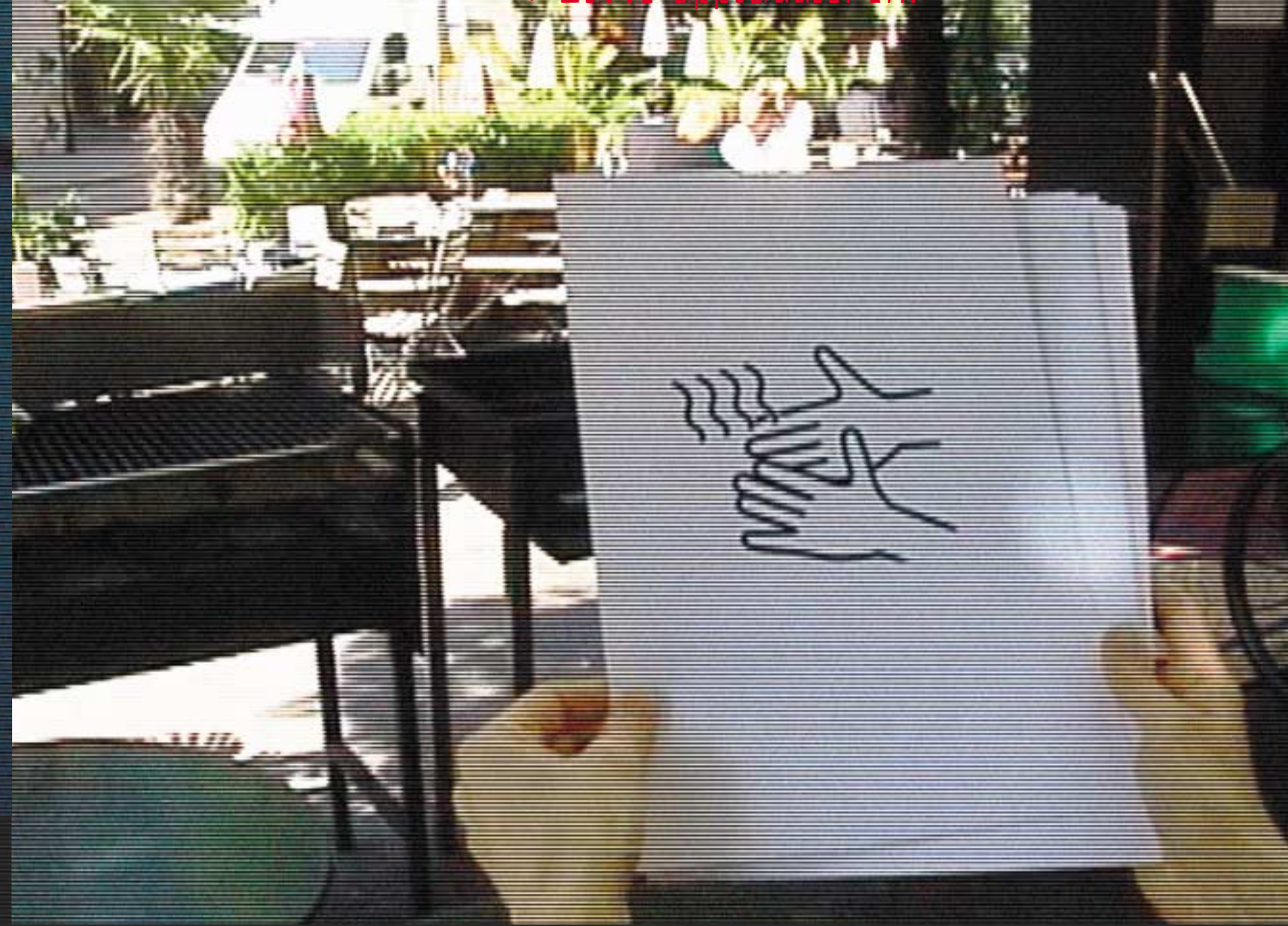
Loesung: Warmluft Haendetroekner.